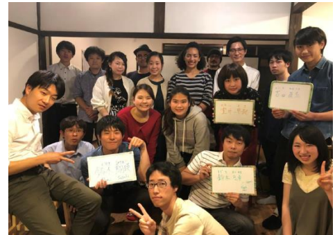
【ふくしま新入生歓迎会】