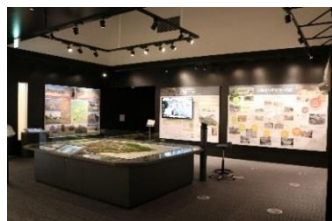
【小峰城ガイダンス展示】