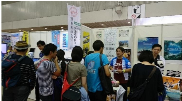
【サイクルモードインターナショナル】

「サイクルモードインターナショナル」(幕張)や「サイクルエキスポ」(さいたま)等、主に首都圏で開催される自転車展示会等において、誘客に向けたPR活動等を行った。