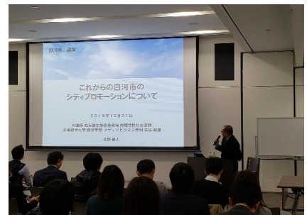
【地域活性化伝道師による講演会】