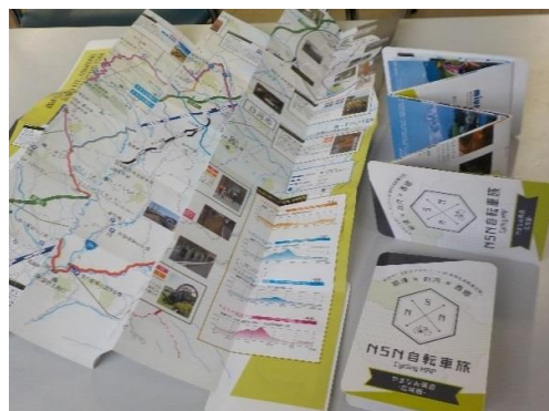
【やまなみ周遊マップ(ミウラ折版)】