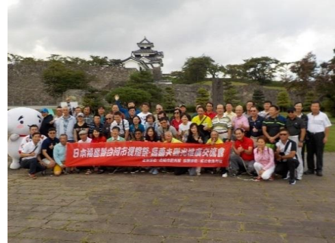
【ゴルフプレー後に小峰城で記念撮影】

白河を中心に那須・会津地域の地域資源を活用し、台湾のメディア及び旅行会社の関係者を対象とした「モニターツアー」を実施し、魅力を広く発信することで認知度の向上を図るとともに、台湾からの誘客を促進し、本地域の活性化を図った。