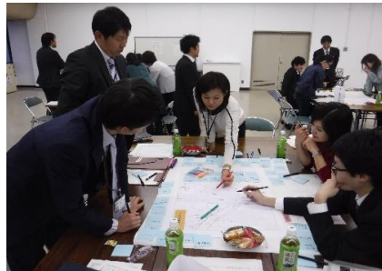
【若手職員によるワークショップ】