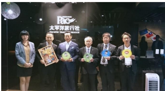
【現地旅行会社へのトップセールス】

本市及び西郷村、栃木県那須町の首長や観光関連団体等が台湾の旅行会社等を訪問し、トップセールスを行うことで本地域の魅力を力強く発信するとともに誘客を促進し、認知度の向上及びインバウンド誘客の獲得を図った。