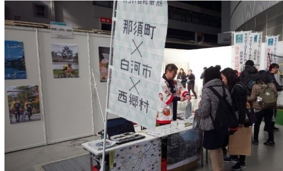
【サイクルエキスポ】