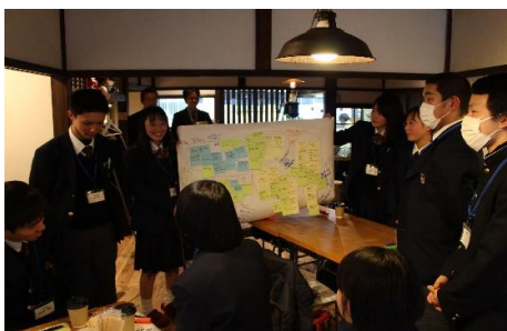
【高校生によるワークショップ】

シティプロモーションの重要性と必要性について市全体が共通認識を持てるよう、講演会を開催した。 また、高校生、市内の企業・団体・市役所の若手職員によるワークショップを開催し、当市の抱える課題や魅力の洗い出し、ロゴマーク・キャッチコピー案の検討を行った。 ワークショップでの検討結果を踏まえ、地域イメージの向上に繋げるための考え方や方向性を示したシティプロモーション基本方針を策定した。