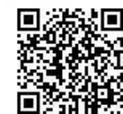
空き店舗バンク 物件情報

◎空き店舗バンクは、空き店舗を売りたい・貸したいと考えている所有者と買いたい・借りたいと考えている利用者をマッチングして空き店舗の流通を図る制度です。