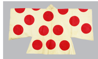
▲ 榉色羅紗地水玉文様陣羽織（小峰城歴史館蔵）