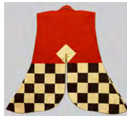
◀緋羅紗地市松文様陣羽織 (小峰城歴史館蔵)