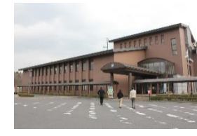
表郷図書館 白河市表郷金山字長者久保2 TEL32-4784