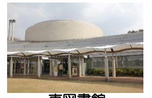
東図書館 白河市東釜子字狐内 47 TEL34-1130