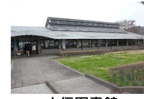
大信図書館 白河市大信町屋字沢田 25 TEL46-3614