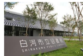
市立図書館「りぶらん」 白河市道場小路 96-5 TEL23-3250