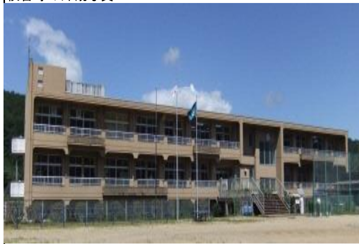
校舎等の外観写真