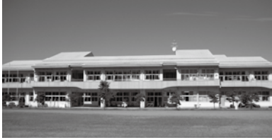
令和6年廃校となる丘の上の五箇中学校

A 通学区域外への入学の検討は必要と考える。 Q 今年も気候変動による百年に一度と言われる「記録的短時間大雨」が頻発し土砂災害、堤防の決壊、河川の氾濫により大きな災害が起こった。3年前の大雨で破損した国体記念体育館裏の阿武隈川の堤防がいまだに復旧されておらず、民家も多くあり住民の命を守る堤防の早急な復旧が望まれるが。 A 早目（9月上旬）に工事を再開する。 Q 全国学力テスト2位の石川県では、子どもたちの学力向上には指導力が大切と考え、教員の指導力向上の養成に力を入れていく。本市の学力テストは平均レベルであるが、白河の児童生徒も石川県の児童生徒も能力に差はない。 A 今の研修体制を再点検し、教員のさらなる指導力の向上を図ってまいりたい。