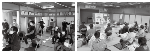
集会所で行われている高齢者サロンの様子

A 高齢者ドライバー事故防止の取り組みとして、加齢に伴う身体機能の変化を理解してもらい継続的な安全運転ができるよう支援してきた。またメーカーでは、「セーフティサポートカー」の開発や普及啓発に取り組んでいる。市においても、関係団体と連携し、各交通安全啓発活動を実施するとともに、今後は家族や家庭において悪天候の際には運転を控えるなどの安全運転について話し合いの場を設ける啓発活動についても検討する。