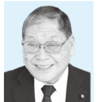
石名 国光 議員