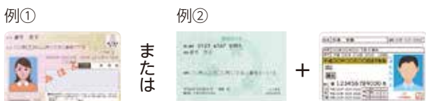
例① マイナンバーカード 例② マイナンバー通知カード＋運転免許証などの身元確認書類