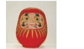
▲白河だるま（昭和36年製）