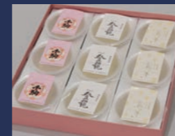
地酒ゼリー 株式会社大黒屋