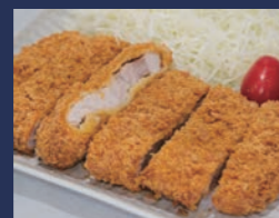
雅とんかつ 肴肉の秋元本店