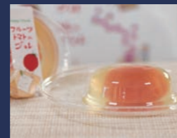
ハッピーアイランド フルーツマトジュレ 株式会社大黒屋