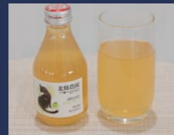
しあわせりんごジュース グラニースミス 北條農園