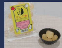
しあわせ飴 りんご 北條農園