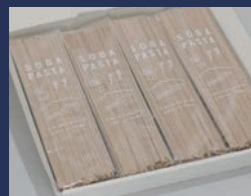
そばパスタ 株式会社カタノ