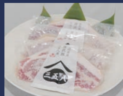
白河高原清流豚 三五八漬け 肴肉の秋元本店