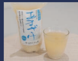
甘酒 ストレート 肴山口こうじ店