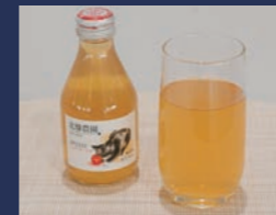
しあわせりんごジュース ジョナゴールド 北條農園