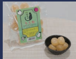
しあわせ飴 もも 北條農園