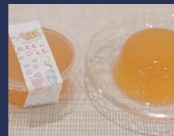
ハッピーアイランド モモジュレ 株式会社大黒屋