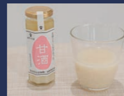
老舗こうじ屋が造った 甘酒 肴山口こうじ店