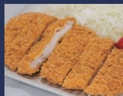
とんかつ 肴肉の秋元本店