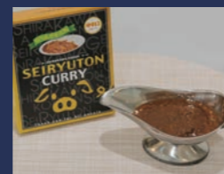
白河高原清流豚カレー 中辛口 肴肉の秋元本店