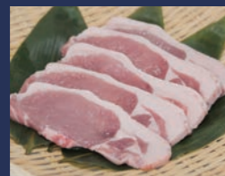
白河ブラック 肴肉の秋元本店