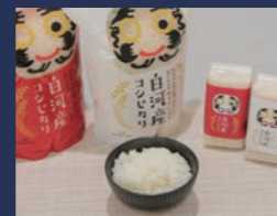
白河産コシヒカリ 白河市産米需要拡大 推進協議会