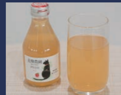
しあわせりんごジュース ふじ 北條農園