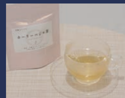
ホーリーバジル茶 ゆうゆうファーム