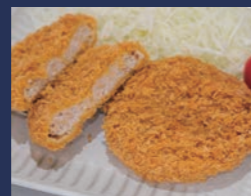
白河メンチ 肴肉の秋元本店