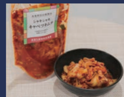
キャベツキムチ こまや(同)