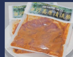
白河高原清流豚 みそ漬け モモ 肴肉の秋元本店