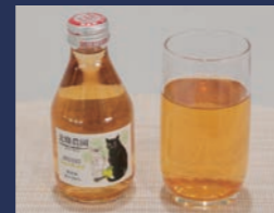
しあわせりんごジュース シナノゴールド 北條農園