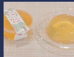
ハッピーアイランド リンゴジュレ 株式会社大黒屋