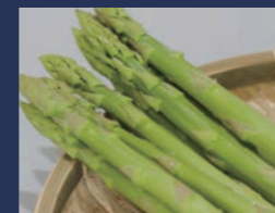
親方アスパラ ガンパ農園