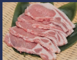
白河高原清流豚 肴肉の秋元本店