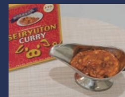
白河高原清流豚カレー トマト味 肴肉の秋元本店