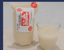
甘酒 濃縮 肴山口こうじ店