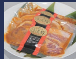
白河高原清流豚 みそ漬け ロース 肴肉の秋元本店