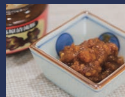
白河高原清流豚 肉みそ 肴肉の秋元本店