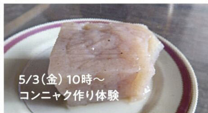
5/3(金) 10時~ コンニャク作り体験