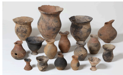
▲天王山遺跡出土品 (一部)