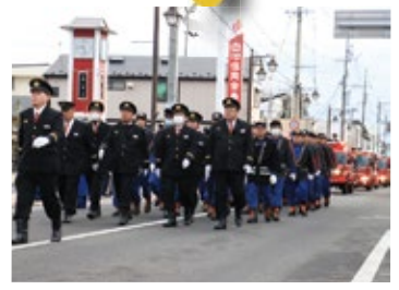
消防団出初式&パレード 1月11日／コミネス・中心市街地