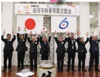
新春市民交歓会 1月5日／シン鹿島