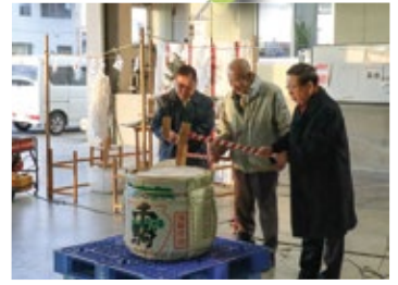
市公設地方卸売市場 初市 1月5日／同市場