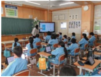
会津大学プログラミング 出張講座 12月16日／関辺小