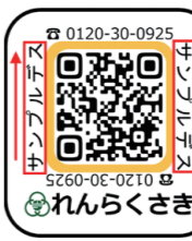
▲見守りシール見本

対象者の身元が 確認できるQRコ ードシールを、衣 服や靴、持ち物な どに貼り付けてお くことにより、万 が一の際に、発見 者がそのQRコードを読み取ることで 早期発見と保護につなげることができ ます。