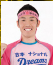
吉本興業所属 がんばれ ゆうすけさん