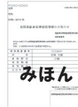
▲資格情報のお知らせ